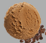
Café 100% arabica de Colombie