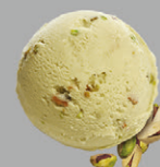
Pistache de Sicile aux éclats de pistache