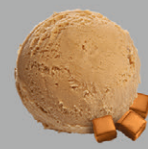
Caramel au beurre et au sel de Guérande