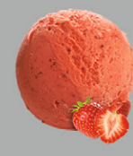
Fraise Senga Sengana