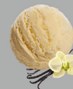
Vanille bourbon de Madagascar