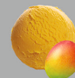
Mangue Alphonso d'Inde